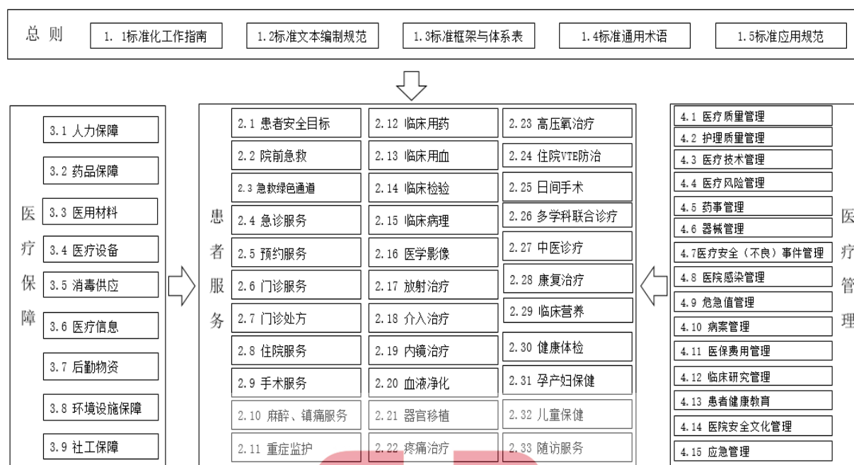
图2 《中国医院质量安全管理》团体标准体系结构框架